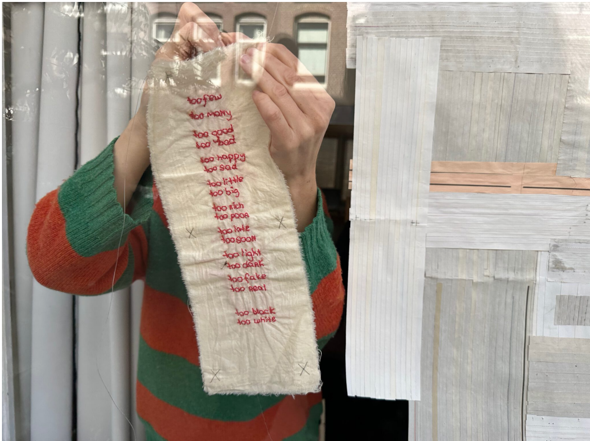
Boukje Janssen in voorbereiding van haar Window_Show, 2023

In de Pijp te Amsterdam is een etalage van een voormalige winkel beschikbaar voor exposities. Eén keer per twee/drie maanden worden kunstenaars uitgenodigd een site-specific installatie te maken, waarbij de smalle ruimte en de verhouding tot het leven op straat een uitgangspunt vormt. De stichting stuurt dan een mailing rond en plaatst een verslag op de website. Het publiek bestaat uit geïnteresseerden, genodigden maar ook toevallige passanten.