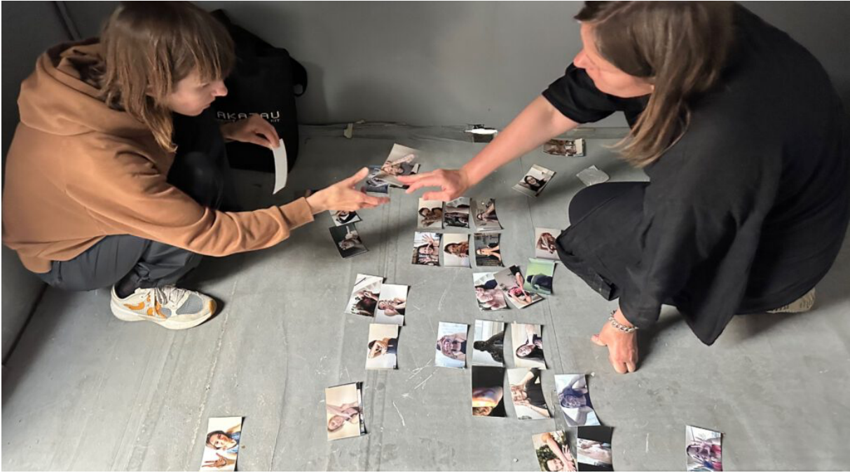
Daycollective in NDSM Fuse, 2024